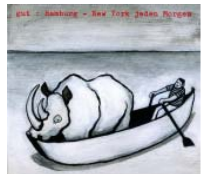
Grafik von Tanja Steinbrück: Plattencover für die Hamburger Band „Gut“ für das Album „Hamburg - New York jeden Morgen“

Text und Illustration Pauliwerft Tanja Steinbrück und Ilka Kreutzträger Paul-Roosen-Str. 12 22767 Hamburg Tel.: 040 - 75663576 www.pauliwerft.de info@pauliwerft.de