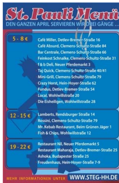
Postkarte vom St. Pauli Menü 2005

Vom 1. bis zum 30. April wird die Aktion laufen und eingeladen sind alle Typen von Gastronomie: von der Kneipe über das Café bis zum Restaurant. Einzige Bedingung für die Teilnahme ist die Verpflichtung, während des Aktionszeitraums ein "dreigängiges Menü" anzubieten. Wie das Menü aussieht, bleibt den Gastronomen freigestellt: Entweder die klassische Variante Vorspeise, Hauptspeise und Nachspeise oder die Version 'n Bier, 'n Korn und Salzstangen. Das Angebot soll die kulinarische und gastronomische Vielfalt des Stadtteils widerspiegeln und die Gäste neugierig machen.